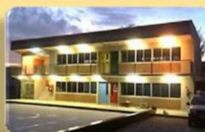
PROYECTO: COLEGIO MANO AMIGA COLINA